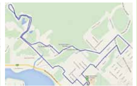
LE FLEUVE- 10 KM