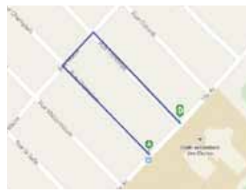
LA RIGOLE – 500 M

En collaboration avec la Municipalité de Rawdon, le dimanche 4 octobre prochain se tiendra la 2 e édition de la Course des Cascades. L'objectif de cette course est d'amasser des fonds pour l'école des Cascades et ainsi financer des activités et l'achat de matériel. Pour vous inscrire, visitez le https://www.inscriptionenligne.ca/course des cascades . Les organisateurs ont besoin de bénévoles, les personnes intéressées peuvent s'inscrire sur le site Internet de la municipalité, en page d'accueil.