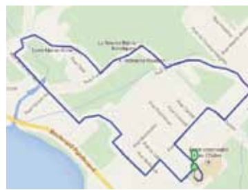
LE RIVIÈRE – 5 KM