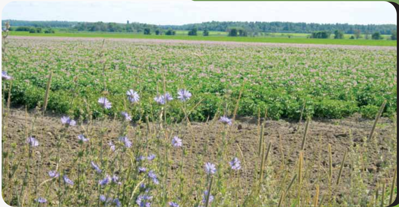
Chemin de Kildare

À LA UNE CET AUTOMNE, PLACE AUX CONSULTATIONS ET À LA PROGRAMMATION DES LOISIRS