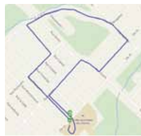
LE RUISSEAU – 2.5 KM